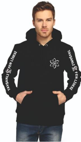
RESİM 2:Sweat modeli